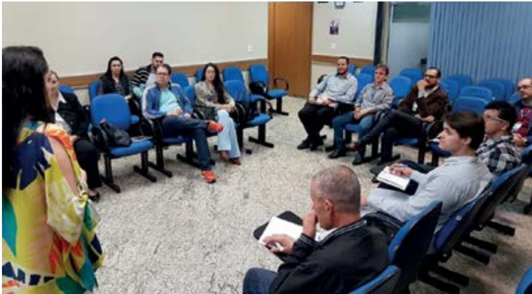
Equipe da RNE – Rede de Negócios Empresariais – reúne-se semanalmente na ACIA

Vários são os desafios do empresário moderno; talvez, o maior deles seja como criar ou manter um relacionamento e, ao mesmo tempo, vender e revender para essa